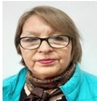
CONSEJO DE LA SOCIEDAD CIVIL COSOC DIRIGENTE SOCIAL EN SALUD GRANEROS